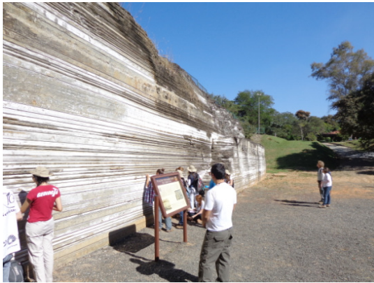
Figura 2. Paredão de varvito no interior do parque, com atentos visitantes e um painel explicativo

Grandes “icebergs” de gelo podem se desprender da geleira principal, muitas vezes fazendo o transporte de blocos redondos de tamanhos variados. À medida que o gelo derrete, as massas de gelo deixam cair a carga sobre o fundo, que deforma sedimentos inconsolidados. Tal é a origem dos seixos “caídos” (Figs. 4 e 5). As camadas depositadas sobre o seixo acomodam-se à saliência, porém gradativamente as camadas vão ficando menos onduladas, em um padrão que é bem descrito pela expressão “dobras supratênuas”.