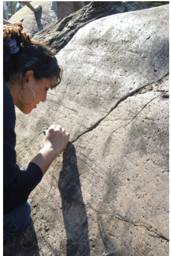
Figura 8. Observadora analisa a superfície polida da Rocha Moutonnée, gerada por abrasão, na qual se percebe com o tato o sentido do deslocamento das massas de gelo, arrastando fragmentos de rochas e outros materiais que sulcaram o granito. As massas moveram-se do canto inferior direito da foto para o canto superior esquerdo.

Na cidade de Salto, a pequena distância da Rocha Moutonnée, três ocorrências merecem destaque. No mesmo sítio do Parque da Rocha Moutonnée, na margem esquerda do rio Tietê. O Porto de Góes testemunha a colonização do século