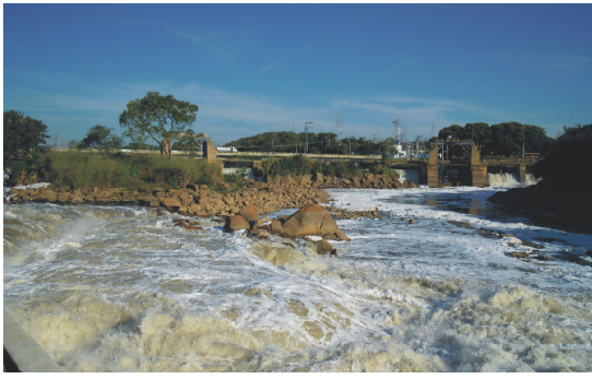
Figura 9. As águas do Rio Tietê a montante do Porto de Góes, testemunho da colonização do século XVII. Os bandeirantes eram obrigados a transportar por terra seus barcos e equipamentos, para vencer a barreira, que atualmente é objeto de obras de engenharia, como pontes e barragens.

XVII (Oliveira 2008) pois representa o início de novo percurso pelos bandeirantes, depois de terem vencido a barreira física das potentes corredeiras de Salto, atualmente interrompidas por obras de engenharia (Fig. 9).