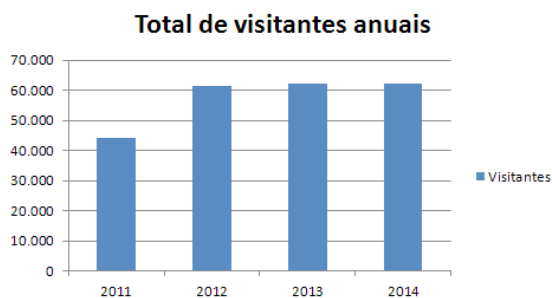
Figura 6. Taxa anual de visitação ao Parque Geológico do Varvito, 2011 a 2014

No caso das eras glaciais, pode-se discutir até mesmo aspectos críticos do debate atual sobre aquecimento global: