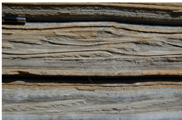
Figura 3. Pormenores de camadas de varvito: (a) camadas de espessura variável, claras e escuras, atravessadas por pequena falha; (b) laminação ondulada, que evidencia a presença de correntes durante a deposição

(a) a existência de outra pedreira abandonada adjacente, situada em nível mais baixo no relevo, e que extraiu camadas sotopostas às do Parque do Varvito, e (b) que existem cortes ainda mais baixos no relevo, à margem da Rod. do Açúcar, onde afloram camadas de varvito (Carneiro 2015).