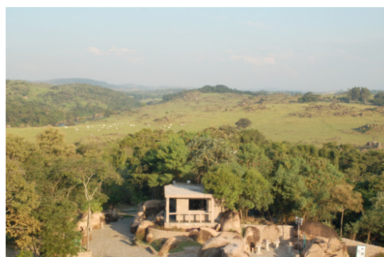
Figura 10. Ao fundo, aparece o relevo tipicamente granítico do Batólito de Itu, por onde correm as águas do Rio Tietê, no canto superior esquerdo da foto. No canto inferior da imagem, emoldurados por matações e blocos de granito, cinco blocos de rocha polida se equilibram sobre pedestais, compondo o Parque das Lavras.

Incontáveis temas geológicos, conceitos científicos e processos estudados na disciplina Ciência do Sistema Terra podem ser explorados nos parques naturais de Itu e Salto. O sucesso das iniciativas municipais justifica movimento organizado, em pontos espalhados pelo País, para identificar zonas de alto interesse geológico que se caracterizem como monumentos geológicos. Em Salto, bem