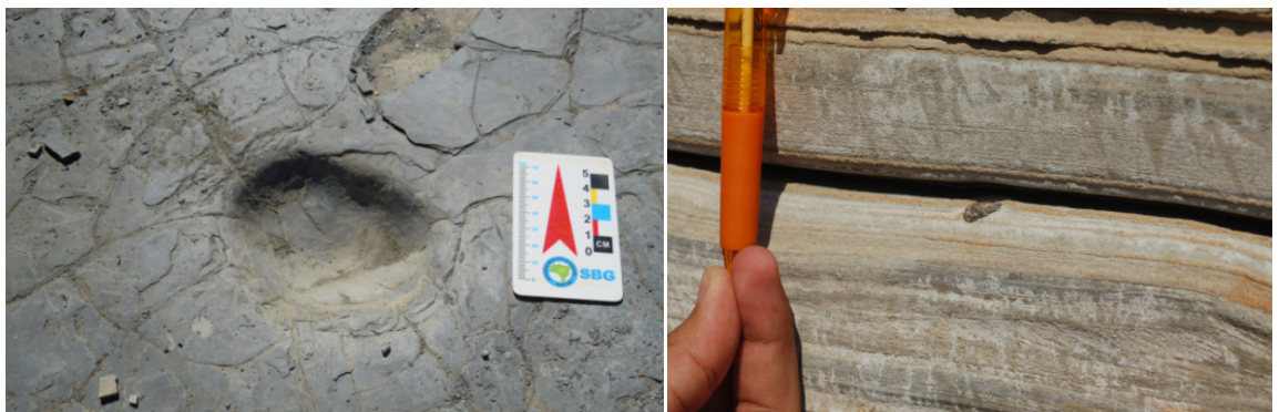
Figura 5. Seixos caídos: (a) pequena depressão elipsoidal que resulta da remoção de seixo caído; (b) aspecto de grânulo imerso em camadas de varvito

Sempre que formamos grupos de estudantes e os convidamos para investigar o ambiente natural, em parques e áreas afins, precisamos refletir sobre a abordagem didática específica a ser adotada (Carneiro et al. 2008). Nos cursos de Geologia e Geografia na Unicamp, turmas grandes de alunos fazem visita regular ao parque (Carneiro et al. 2008), quando aplicamos roteiro de campo do tipo indutivo (Compiani & Carneiro 1993). Convidamos o estudante a examinar as rochas presentes nos cortes, comparando-as com aquelas observadas em outros locais, sem prestar atenção, logo de partida, nos painéis e cartazes. Na atividade, ignoram-se os painéis existentes no parque, ricos em descrições e informações interessantes. Perguntas intencionais dos guias dirigem o olhar para os cortes e captam as dúvidas de cada um. Os alunos realizam trabalho razoavelmente autônomo e estimulante, pois o aluno enxerga a rocha “com os próprios olhos” (Carneiro 2015).