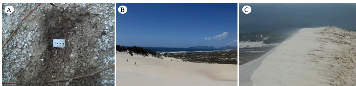
Figura 3. A - Sambaquis observados na praia de Fora em SFS. B - Dunas da Joaquina em FLO. C - Orientação do vento no campo dunar, localizados em FLO

Nesse contexto, no litoral sul de Santa Catarina, encontramos dois sistemas lagunares responsáveis pelo aporte de fluvial proveniente do continente: a Lagoa da Conceição que compõem o sistema lagunar em FLO, apresentando desembocaduras mais restritas; e o sistema lagunar de Laguna (LAG). Em FLO grande parte do aporte fluvial é proveniente do continente, servindo como uma armadilha de sedimento com profundidade média de 1,7 m (Muehe & Caruso Gomes Jr. 1983).