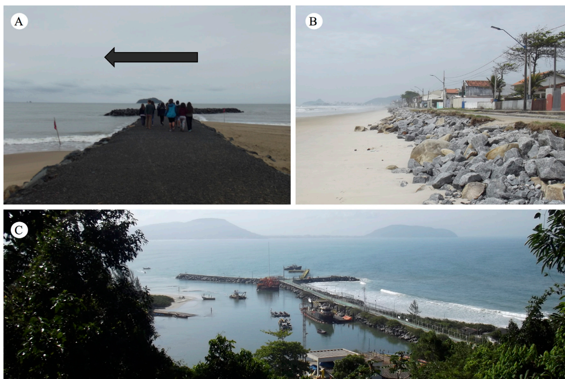
Figura 4. A - Terminal Marinho da Petrobras em São Francisco do Sul (SFS) que formou à direita da foto a praia da Petrobras. B - Obras de contenção costeira no Balneário Barra Sul (BBS). C - Gabião no Balneário de Piçarras (PCS) barrando a deriva litorânea que seguiria na direção da indicada na seta da foto A, acumulando sedimento à direita e erodindo à esquerda do empreendimento.

a fim de conter a ação erosiva marinha (Fig. 4C). Visando uma maior durabilidade, alguns fragmentos do enrocamento estavam recobertos por geotêxtil, um produto permeável utilizado predominantemente na engenharia geotécnica, com funções de drenagem, filtração, reforço, separação e proteção. Entretanto, não foi previsto que esse tipo de construção barraria o transporte de sedimentos da deriva longitudinal ocasionando o aprisionamento de partículas em um lado da estrutura e erosão no lado subsequente. Por outro lado, no Balneário de Piçarras há uma intensa atividade erosiva em sua costa, em consequência disso era especulado a construção de, pelo menos, mais dois espigões. O objetivo desses espigões seria a redução da corrente de deriva litorânea e a estabilização do sedimento disposto em projetos de alimentação artificial da praia, ampliando o tempo de vida. Este processo consiste na introdução mecânica de uma imensa quantidade de sedimentos próximos à costa. Obras desse porte permitem que sistemas praias erodidos se estabilizem ou ampliem, podendo resultar em criação de novas praias, como é o caso da “Praia da Petrobras”, em SFS.