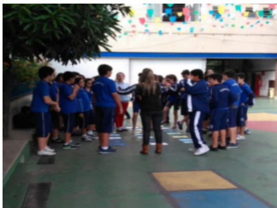
Figura 6. Alunos do 7º ano (turma 711) do ano 2016 jogando no pátio do colégio Carrescia