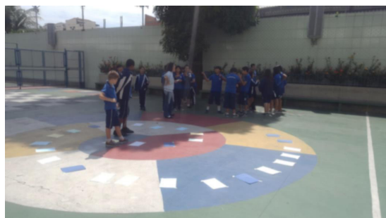
Figura 5. Alunos do 7º ano (turma 710) do ano 2016 jogando no pátio do colégio Carrescia.

Para o 6º ano do Ensino Fundamental II, a atividade foi concluída no dia 04 de outubro de 2016 para as turmas do colégio. Tanto para a turma 610 quanto para a 611 houve a divisão de 2 grupos por ordem alfabética diferenciando somente o local de aplicação do jogo: a turma 610 fez no laboratório de Biologia enquanto que a turma 611 fez na sala de aula habitual como já comentado anteriormente. Na turma 610 ocorreram 3 ausências no dia da aplicação do jogo enquanto que na turma 611 não manifestou ausências.