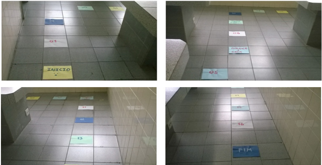
Figura 3. Mosaico do tabuleiro montado no laboratório de Biologia do IPLC para o jogo do 1º ano do EM (ano base 2017)

somente os alunos ímpares compareceram na aula laboratorial de Biologia, disciplina extracurricular ofertada para agregar pontos na matéria, e estes ainda se dividiram em 2 grupos, por ordem alfabética, com 10 alunos cada. Neste grupo dos ímpares, ocorreram 4 ausências. No 2º ano do Ensino Médio também ocorreram duas divisões entre o grupo dos alunos ímpares ao qual cada grupo ficou com 8 alunos porque manifestou-se 5 ausências nesta data.